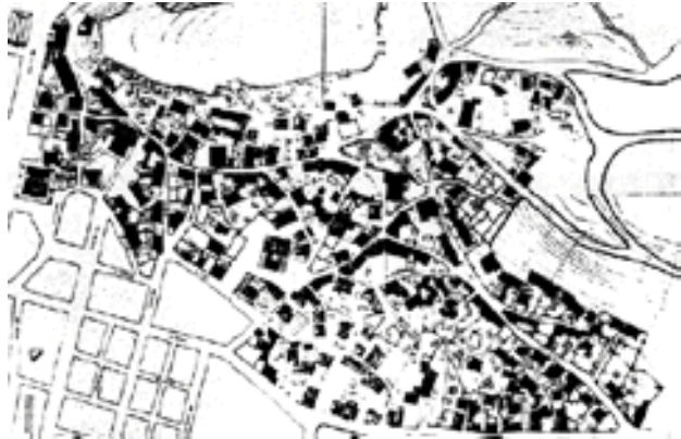
Σχέδιο 3: Φυσική οικιστική δομή και συστηματική επέκταση. Πηγή: Τσαπαλά-Βαρδούση, Φ., Τρίκαλλα, Θεσσαλία, Ήπειρος, τομ. 3, Μέλισσα, Αθήνα, 1988, σελ. 94.

Αναζητείται η «κρίσιμη μάζα», ανθρώπων και λειτουργιών, ώστε η συνεκτική δόμηση να είναι βιώσιμη. Για την έκταση της οικιστικής οργάνωσης προτείνονται τα 160 εκτάρια, ενώ για την πυκνότητα οι προτάσεις διαφοροποιούνται μεταξύ των αστικών και των αγροτικών περιοχών, της ποικιλίας των αντίστοιχων ορισμών. 19 Κύρια διαφοροποίηση της πυκνότητας προκύπτει από την κάθετη ανάπτυξη των λειτουργιών σε χαμηλά ύψη (2-4 όροφοι) με μεγάλη πυκνότητα.