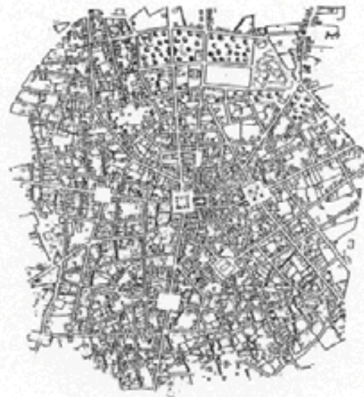
Σχέδιο 4: Παραδοσιακό σχέδιο οικισμού και πρώτη φάση νεο-παραδοσιακής (ανα)δόμησης (1828).