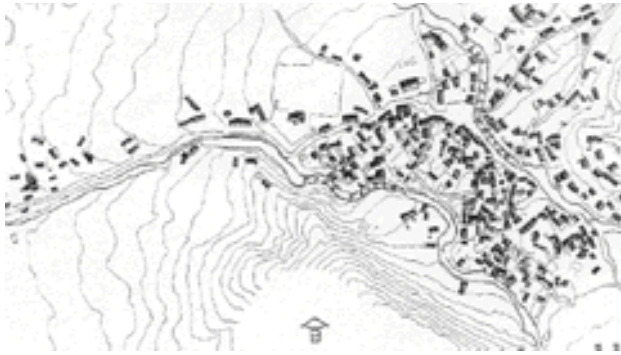
Σχέδιο 1: Παραδοσιακός οικισμός/Φυσική διανομή