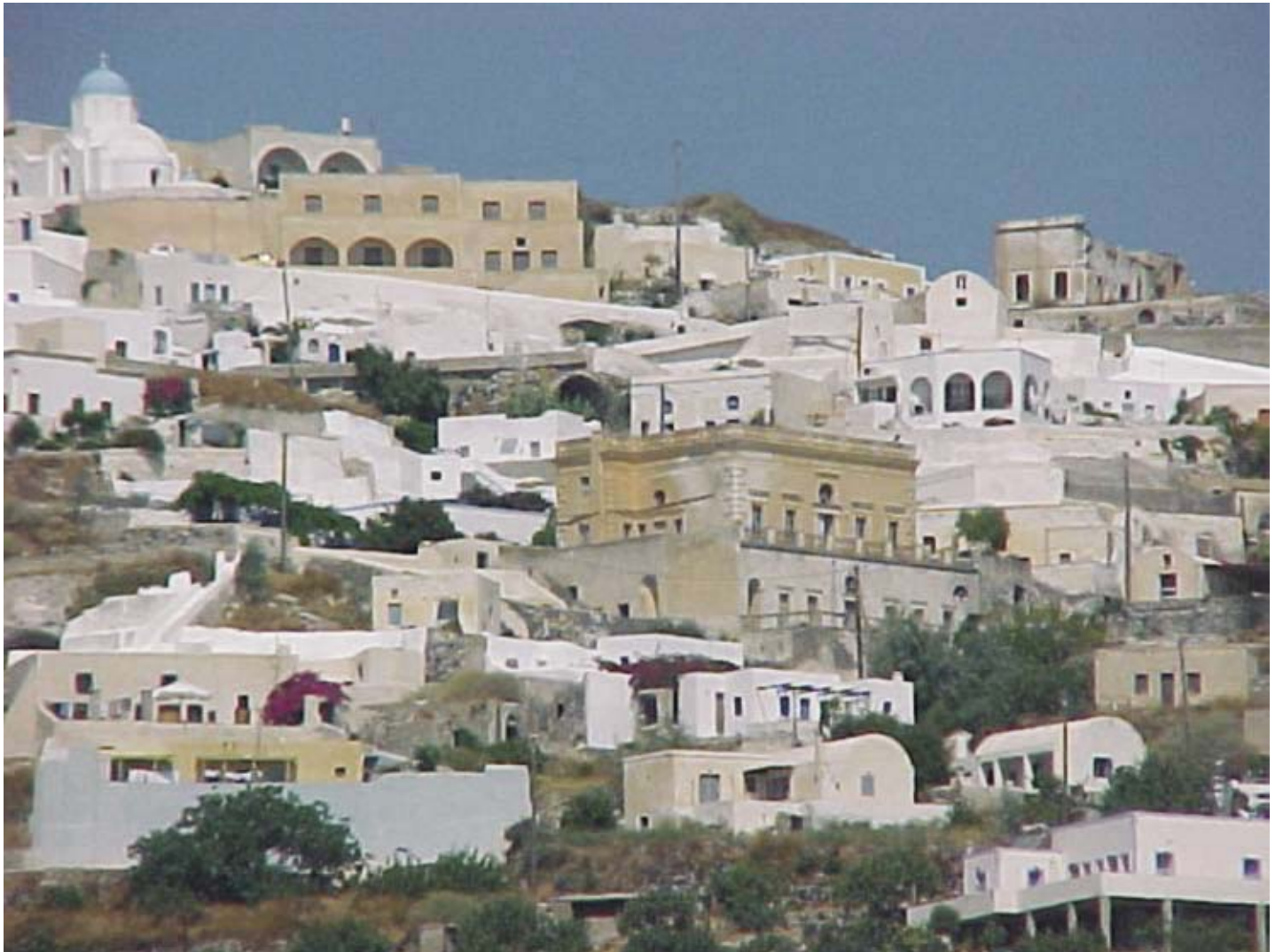
Εικ. 5: Οικισμός Εξω Γωνιά.