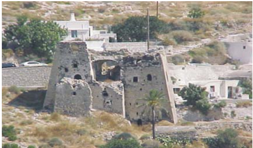
Εικ. 3: Γουλάς στο Εμπορείο.

Σήμερα στη Σαντορίνη κατοικούν περίπου 8.000 κατ. σε 30 οικισμούς. Πρόκειται για το δεύτερο σε σειρά πυκνοκατοικημένο νησί των Κυκλάδων μετά τη Σύρο, με πυκνότητα 117 κατ./τ.χλμ. Όλοι οι οικισμοί της Σαντορίνης έχουν πληθυσμό μικρότερο των 2.000κατ., δηλαδή συνολικά ο πληθυσμός του νησιού προσμετράτε στον αγροτικό πληθυσμό της Ελλάδας. Το 73% των οικισμών (22 οικισμοί), ανήκουν στην κατηγορία “μικροί” 8 ως προς το μέγεθος, δηλαδή έχουν πληθυσμό μικρότερο των 500κατ., το 23.5% (7 οικισμοί) είναι ταξινομημένα ως “μεσαίοι”, με πληθυσμό μεταξύ 500 και 1500κατ. και μόνο 3.5% (1 οικισμός) είναι “μεγάλος” με πληθυσμό μεταξύ 1500κατ. 2000κατ. Σε όλους τους οικισμούς παρατηρείται έντονη οικοδομική δραστηριότητα και θετική μεταβολή πληθυσμού κατά την τελευταία δεκαετία.