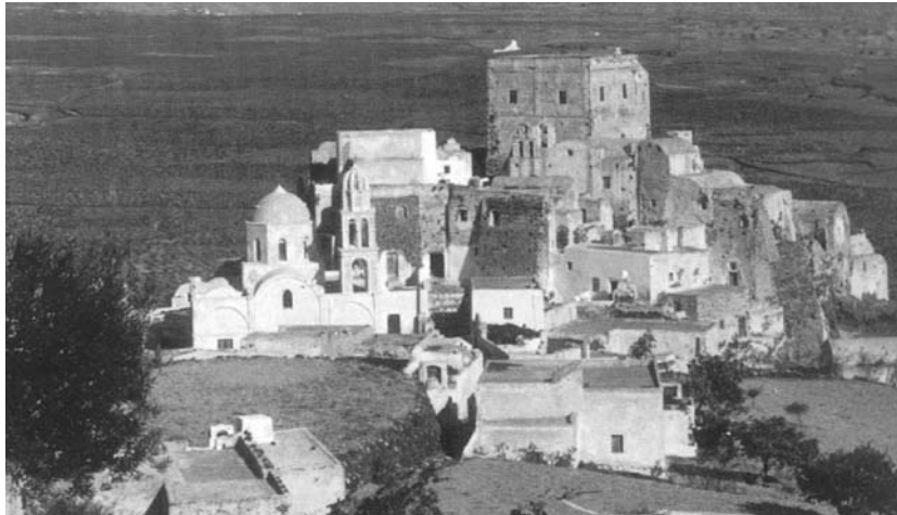
Εικ. 2: Το καστέλλι του Ακρωτηρίου, 1948.

Οι “βίγλες” ήταν στρογγυλοί πύργοι στις ακτές, όπου διέμεναν φύλακες για εποπτεία, ερείπια των οποίων υπάρχουν στο Ημεροβίγλι, και στη θέση Βίγλα στο νότιο τμήμα του νησιού.