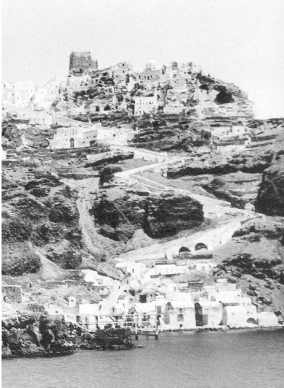
Εικ.70: Οία και Αμούδι, (1925).