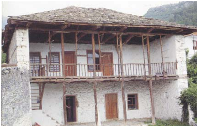
Εικ.5: Λίθινη δομή και ξύλινος σκελετός «ανοικτής» τυπολογίας.

Πηγή: Ν. Μουτσόπουλος, Βαλκανική Παραδοσιακή Αρχιτεκτονική, Ελλάδα, σ.24.