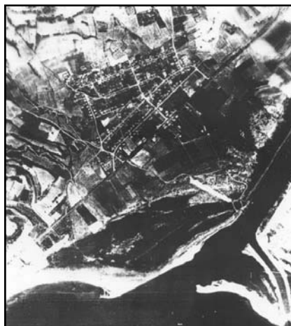
Εικ. 3: Αεροφωτογραφία του σχεδιασμένου το 1945 οικισμού Κερδύλλια (συστηματικός σχεδιασμός).