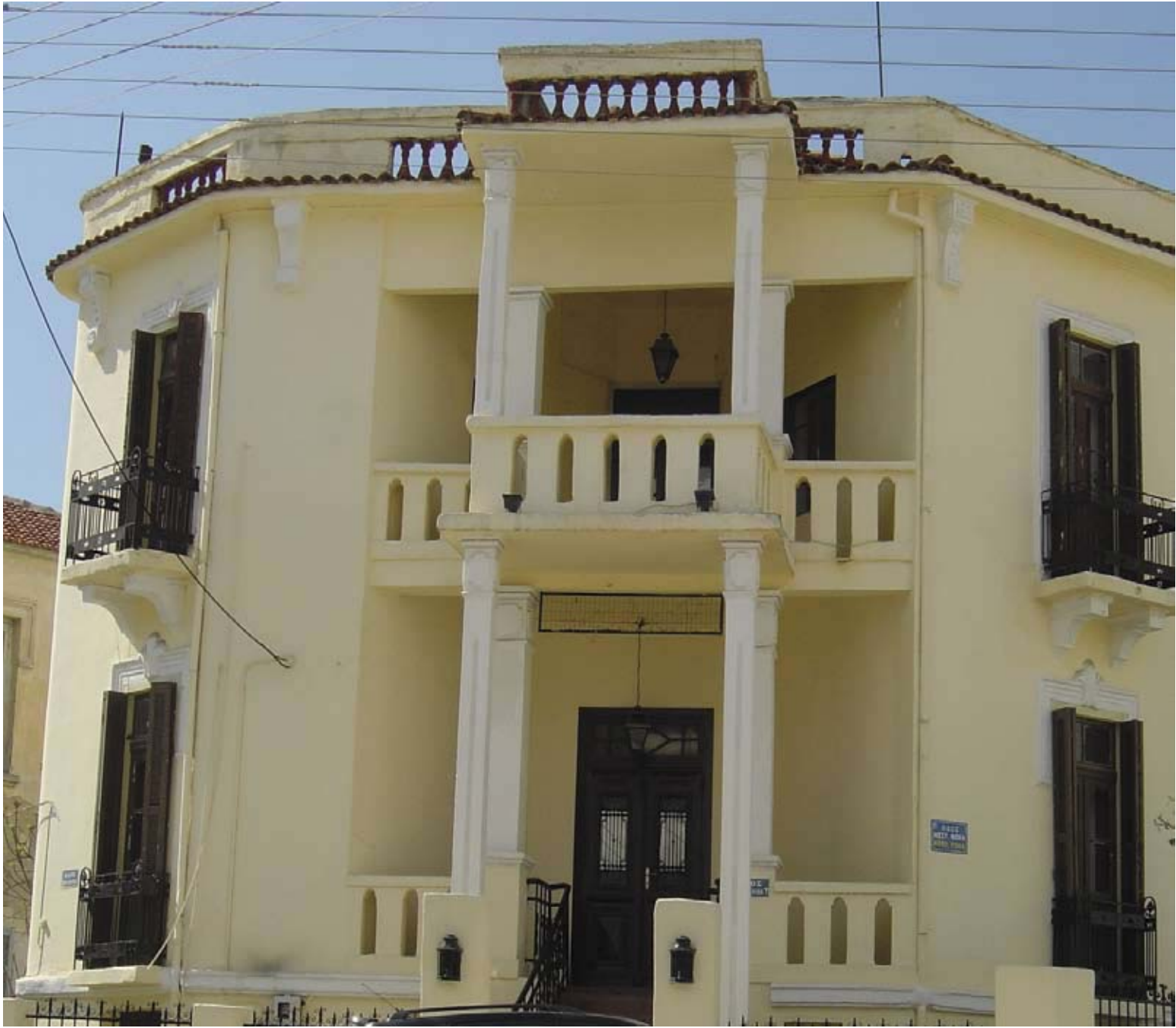
Εικ. 8: Διάφορες αναπαρστάσεις μετά το 1930.