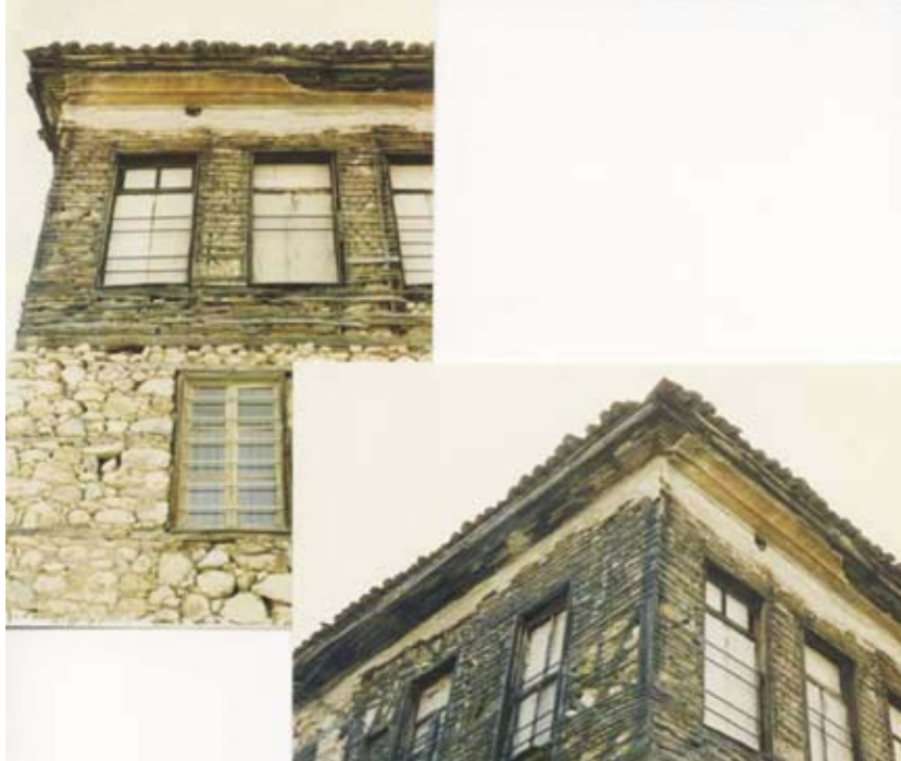
Εικ.6: «Κλειστός» ορθογώνιος όγκος, στο Νεο Σούλι.