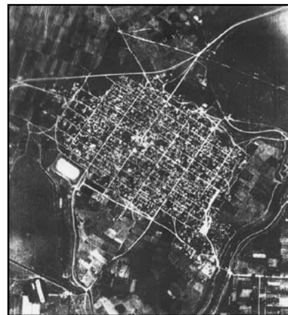
Εικ.2: Αεροφωτογραφία του σχεδιασμένου το 1923 οικισμού Νέος Σκοπός (συστηματικός σχεδιασμός).