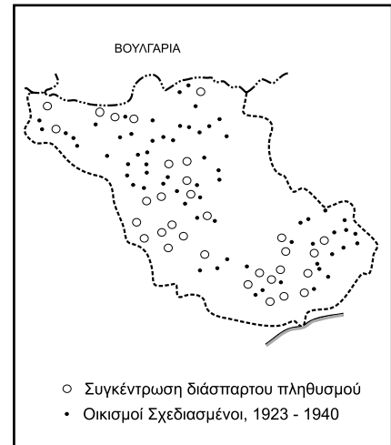
Χάρτης 1.: Οικισμοί αποκατάστασης προσφύγων Ν. Σερρών.

Με την αύξηση του πληθυσμού, μετά το τέλος του Α΄ Παγκόσμιου πολέμου, ο ελληνικός χαρακτήρας του νομού τονώθηκε και η πυκνότητα ανήλθε σε 46,48 κατ./τ.χλμ. Συγχρόνως με υδραυλικά και εγγειοβελτιωτικά έργα ελέγχθηκε ο ποταμός Στρυμόνας και αυξήθηκε η γεωργική παραγωγή. Η δημογραφική εξέλιξη του μεσοπολέμου αντανάκλα το βαθμό της εγκατάστασης νέων κατοίκων. Ο αριθμός των οικισμών αυξήθηκε και πολλές φορές άλλαξαν όνομα και θέση. Οι οικισμοί που σχεδιάστηκαν για τους πρόσφυγες τοποθετήθηκαν στην πεδιάδα και αρχικά σχεδιάστηκαν από αλλοδαπούς και Έλληνες αρχιτέκτονες της "Επιτροπής Αποκατάστασης Προσφύγων". Στη συνέχεια ανέλαβε το ελληνικό Υπουργείο Γεωργίας το οποίο εφάρμοσε «ιπποδάμειες» διευθετήσεις για τη διανομή των οικοπέδων σε νέους οικισμούς, όπως και για τις αγροτικές εκμεταλλεύσεις. Όπου ήταν εφικτό νέοι κάτοικοι κατοίκησαν εγκαταλειμμένα χωριά και σπίτια (χάρτης 1).