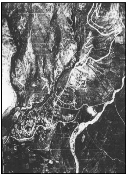
Εικ. 4: Αεροφωτογραφία του «αυθόρμητου» το 1970 οικισμού Ονούσσα (φυσικός σχεδιασμός).

Από πληροφορίες της Στατιστικής Υπηρεσίας, του Υπουργείου Εσωτερικών, της βιβλιογραφίας και κυρίως εξετάζοντας αεροφωτογραφίες της περιοχής, προκύπτει το συμπέρασμα ότι από τους 136 οικισμούς, το 25% των οικισμών της περιοχής προϋπάρχει του έτους 1923, το 25% σχεδιάστηκε ειδικά για τους πρόσφυγες από την Ανατ. Θράκη, 25% χωροθετήθηκε κατά το μεσοπόλεμο και το υπόλοιπο 25%, μετά το Β΄ Παγκόσμιο πόλεμο.