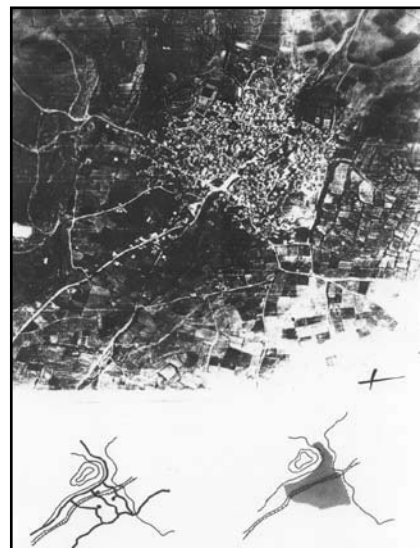
Εικ. 1: Αεροφωτογραφία του υφιστάμενου το 1923 οικισμού Νέο Σούλι (φυσικός σχεδιασμός).

Η χωροταξική κατανομή των οικισμών του νομού Σερρών, αντανακλά την ιστορική τους ταυτότητα. Περιμετρικά στις ορεινές και ημιορεινές περιοχές που περιβάλλουν το νομό κατανέμονται οι παλιότεροι οικισμοί, ενώ στο κέντρο κατά μήκος του ποταμού Στρυμόνα οι μεταγενέστεροι, οι οποίοι ακολούθησαν τα αρδευτικά έργα και τη σύγχρονη αγροτική ανάπτυξη. Οι πιο πρόσφατοι τοποθετούνται κατά μήκος των οδικών αξόνων ή σε θέσεις, όπου αναμένεται κάποια ειδική ανάπτυξη.