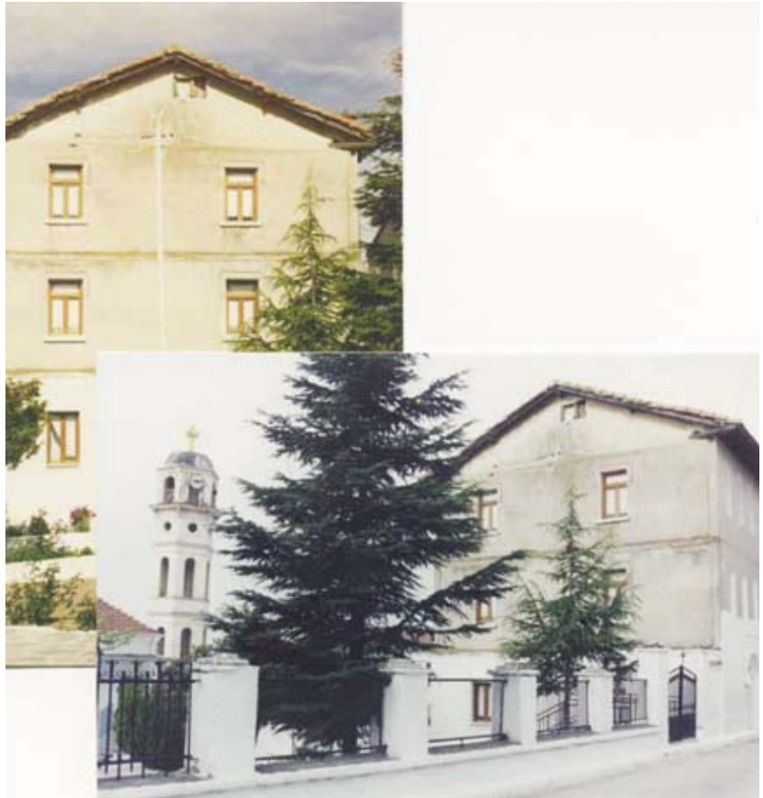
Εικ.7: «Δίρριχτη» στέγαση στις αρχές του 20ου αιώνα, στο Νέο Σούλι.

οικισμό Νέο Σούλι το 1927 5 . Οι παραδοσιακές κατοικίες είναι διώροφες και ορίζουν δύο κατηγορίες. Η πρώτη κατηγορία χαρακτηρίζεται από τη μεγάλη βεράντα στον όροφο, όπου γίνεται η προσπέλαση συνήθως από εξωτερικό ξύλινο κλιμακοστάσιο(εικ.5), ενώ η δεύτερη έχει κλειστό ορθογώνιο όγκο (εικ 6). Και στις δύο περιπτώσεις η στέγαση γίνεται με τετράρριχτη κεραμοσκεπή. Στα τέλη του 19ου αιώνα καταγράφονται λίγες κατοικίες, οι οποίες έχουν κλειστό ορθογώνιο όγκο και συμμετρία στις όψεις, ενώ στεγάζονται με δίρριχτες στέγες, ως αποτέλεσμα της επίδρασης του νεοκλασικισμού (εικ.7).