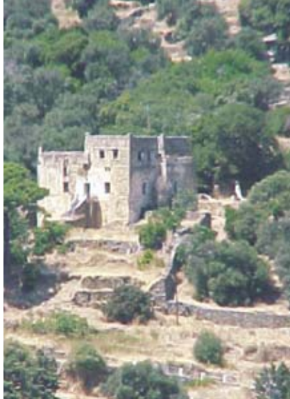
Εικ. 7: Πύργος του Μπίστη, στις Στενιές (1800).