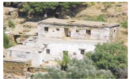
Εικ. 4: Πλατυμέτωπη διάταξη στον Κατάκοιλο.