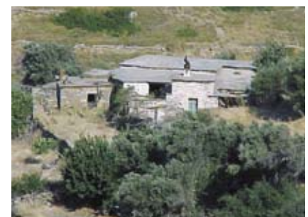
Εικ.11: Πολύσπαστη οργάνωση αγροτικής κατοικίας, στην περιοχή της Μονής Αγιάς (Ζωοδόχου πηγής).