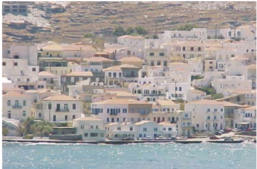
Εικ.2: Παραθαλάσσιο μέτωπο στη Χώρα της Ανδρου.