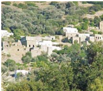
Εικ.8: Διάταξη πυργόσπιτων στο Κόρθι.

Μαστρογιαννούλη 8 , 1810), στις Στραπουργιές (του Φολερού, 1797), στις Στενιές (του Μπίστη, 1800) (εικ.7) και στη Μεσαριά (του Λορέντζο Καίρη, 1750 9 ). Έχουν ορθογώνια κάτοψη, τρία συνήθως πατώματα και στεγάζονται με δώματα, δημιουργώντας ταράτσες σε διάφορα επίπεδα, καθώς ο όγκος ελαττώνεται στους επάνω ορόφους. Στο ισόγειο βρίσκονται οι αποθήκες, οι βοηθητικοί χώροι και τα λαγούμια σε περίπτωση ανάγκης διαφυγής. Στον πρώτο όροφο, δημιουργείται η είσοδος –με κινητή πρόσβαση– η οποία φέρει στο υπέρθυρο το οικόσημο του ιδιοκτήτη και οι χώροι υποδοχής και διημέρευσης με λιγοστά μικρά παράθυρα. Στο δεύτερο όροφο οργανώνονται τα υπνοδωμάτια, τα οποία έχουν έξοδο στις ταράτσες.