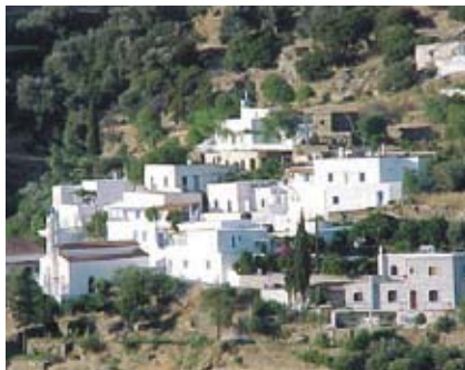
Εικ. 14: Επίπεδη στέγαση στον Επισκοπεϊό.