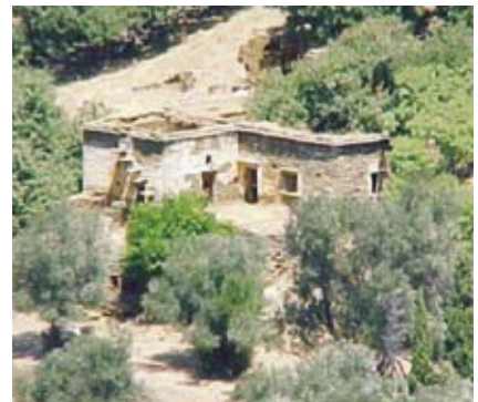
Εικ. 5: Πλατυμέτωπη διάταξη στον Αρνά.