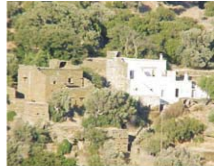
Εικ.9: Πολυκτταρικές διατάξεις στους Μωρακαίους.

Πρόκειται για κατοικίες που δομούνται σύμφωνα με τη σύγχρονη οικοδομική τεχνολογία, την οικονομία και το θεσμικό πλαίσιο δόμησης, στις οποίες γίνεται προσπάθεια, σύμφωνα με την αντίληψη του εκάστοτε μελετητή, να εφαρμοστούν τοπικά αρχιτεκτονικά χαρακτηριστικά.