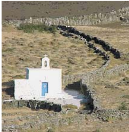
Εικ. 13: Εκκλησιάκι στο Χαλκιολιμνιόνα.