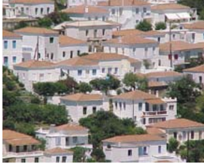
Εικ. 12: Τετράρριχτες κεραμοσκεπές στις Στενιές.