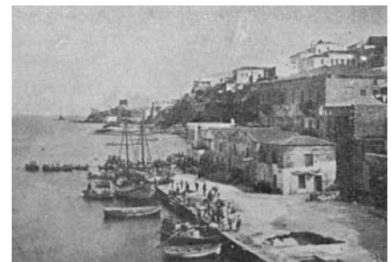
Εικ. 10: Η προκουμαία της Χώρας, (1885).