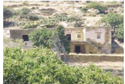
Εικ. 3: Πλατυμέτωπη διάταξη στη Μελίδα.

Στο σκίτσο του Pitton de Tournefort (εικ.1), παρουσιάζονται ορθογώνιοι όγκοι, διάσπαρτοι στο «Μέσα Κάστρο» της Χώρας, που δε σώζονται σήμερα. Οι παλαιότερες οχυρές κατοικίες, που σώζονται στην Άνδρο, (18ος αιώνας) είναι πυργόσπιτα 7 και βρίσκονται στον Αμόλοχο (του