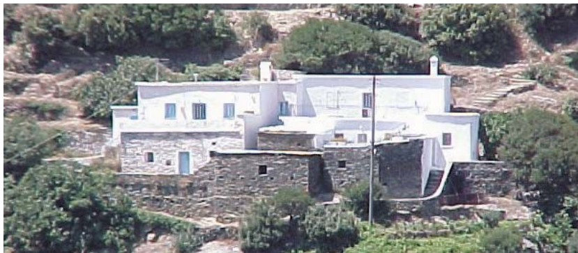
Εικ. 6: Πλατυμέτωπη διάταξη στους Κατακαλαίους.